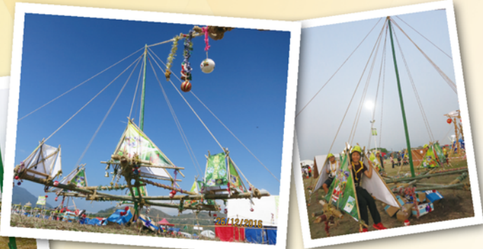
文：新界第 1059 旅、十八鄉第 18 旅、元朗西第 24 旅及荃灣第 5 旅

新 界地域伍海山分營在 9 個分營比賽均獲獎，有份參加的你和妳，也是締造佳績的一份子。